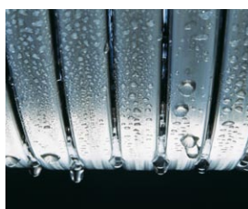
Wymiennik ciepła Inox-Radial ze stali szlachetnej odporny na duże obciążenia termiczne