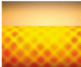
Palnik promiennikowy MatriX idealnie dopasowany do wymiennika ciepła