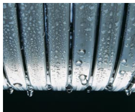
Wymiennik ciepła Inox-Radial