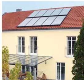
Vitosol 200-F na dachu budynku dwurodzinnego