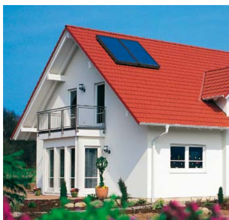
Instalacja z dwoma kolektorami Vitosol 200-F na dachu budynku jednorodzinnego

Więcej informacji o kolektorach słonecznych oraz możliwości uzyskania dotacji znajdują Państwo na stronach internetowych: